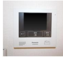
モニター付インターホン